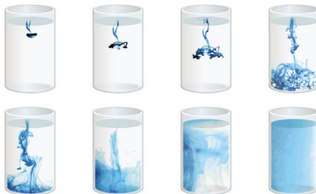
FIGURE 2 – Convection/Diffusion d'une goutte d'encre dans l'eau

Les phénomènes de diffusions (thermique ou de matière) sont régis par des équations différentielles faisant apparaître une dérivée première d'une grandeur thermodynamique 2 par rapport au temps et une dérivée seconde de la même grandeur par rapport aux variables d'espaces. Le phénomène de diffusion est donc non invariant par le changement de variable t \rightarrow -t ce qui est la marque de l'irréversibilité.